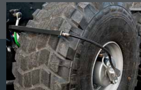
▲ TYRE INFLATION SYSTEM / SYSTEME DE GONFLAGE PNEUS