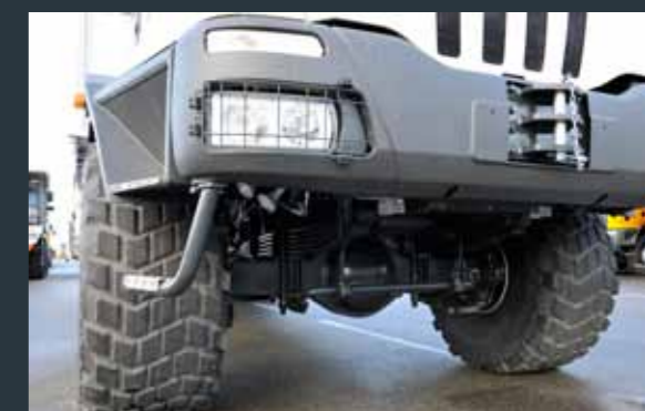
▲ DESERT TYRES / TRAIN DE PNEUS DESERT