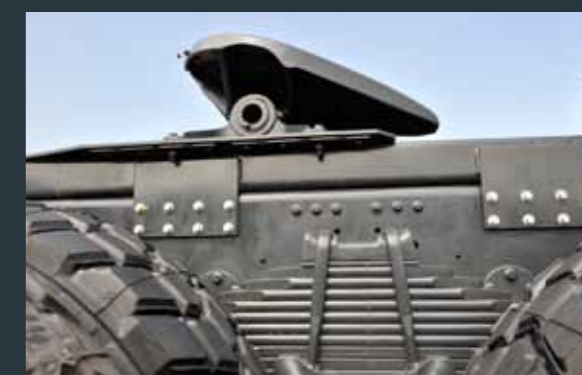
▲ RALLA JSK 50 TON / COURONNE JSK 50 TON.