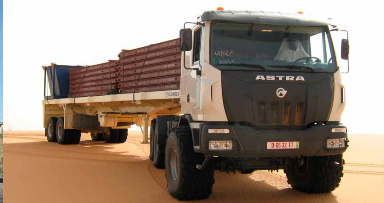
▲ DESERT TYRES / TRAIN DE PNEUS DESERT