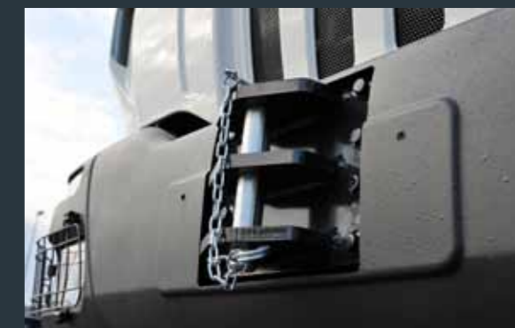
▲ HEAVY DUTY FRONT HOOK / CROCHET AVANT HEAVY DUTY