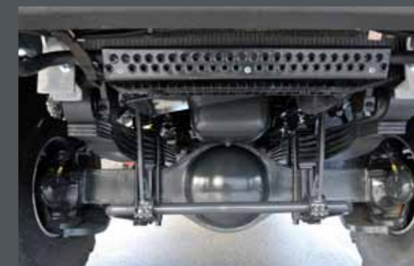
▲ HEAVY DUTY AXLES / ESSIEUX HAUTE RÉSISTANCE