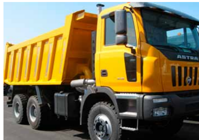
▼ WINTERISATION / HIVERNAGE

Le point fort du modèle HHD8 est de pouvoir être proposé en de nombreuses versions. Des conceptions de projet ad hoc et des solutions techniques spécifiques permettent aux entreprises du monde entier d'avoir des engins assurant une productivité élevée, une grande fiabilité et des réponses concrètes aux exigences particulières de transport.